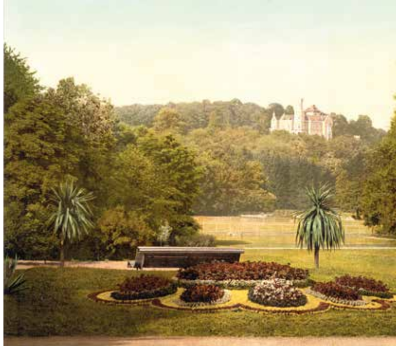
Historische Ansicht: Blick vom Schmuckplatz auf die Tennisplätze