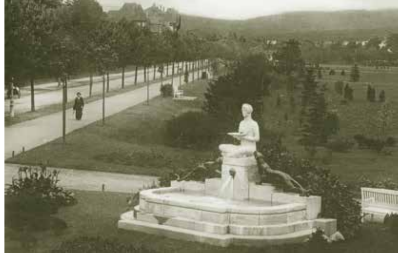
Historische Aufnahme des Durstbrunnens