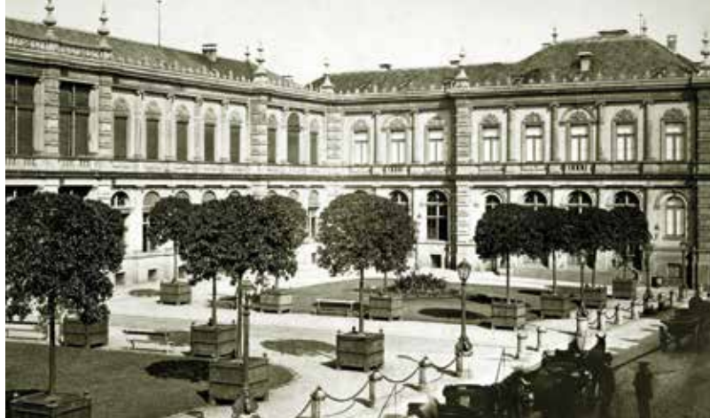
Kurhaus von 1863