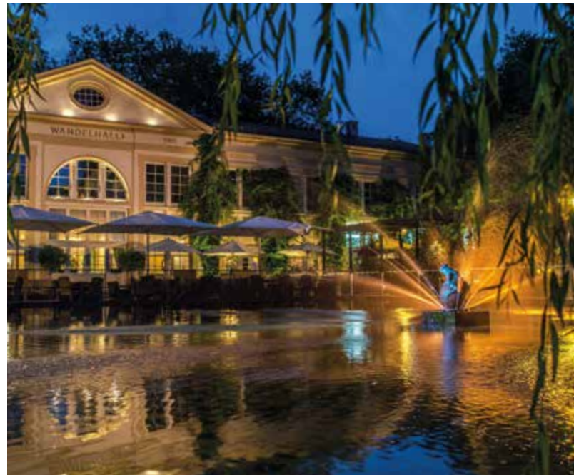
Orangerie mit Froschkönigteich

Das Wasser der Elisabethen-, Louisen-, Auguste-Viktoria- und Landgrafenquellen kann auch hier an der Orangerie gezapft werden.